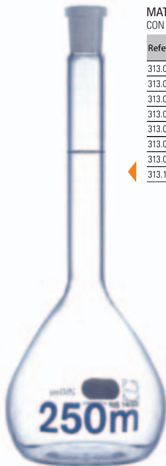
MATRACES AFORADOS VIDRIO CON TAPON PLASTICO, CLASE A, VIDRIO BOROSILICATO. AUTOCLAVABLES.