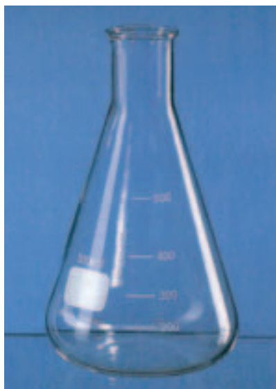
FASTLaS MATRACES ERLENMEYERS. VIDRIO BOROSILICATO. AUTOCLAVABLES.